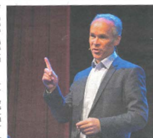
REFORM: Større kommuner gir mer attraktive arbeidsregioner, mener kommunal- og moderniseringsminister Jan Tore Sanner (H).

- Jeg har stor tro på næringsklynger. Samarbeid bidrar til innovasjon, understreket han.