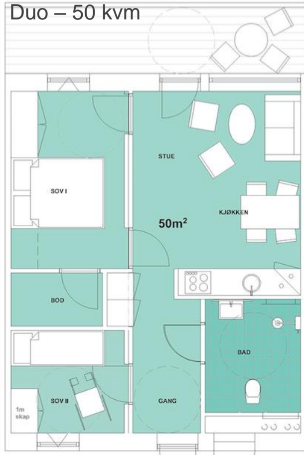
Duo – 50 kvm