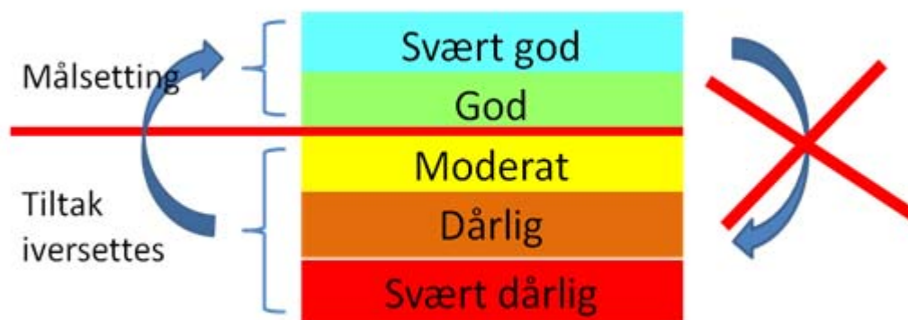
Figur: Kjemisk og økologisk kvalitet- klassifisering

Direktivet legg opp til ei ambisiøs forvaltning av fersk- og kystvatn. Målsettinga er å få alle vassforekomstar opp på minimum godt nivå, sjå figur under. For å få dette til må det gjennomførast ein karakterisering av vassforekomstane. Basert på dei funn som blir gjort under karakteriseringa skal vassforekomstane klassifiserast etter kva tilstand dei er i, skalaen går frå svært dårleg til svært god. For vassforekomstar som oppnår ei klassifisering lågare enn god, skal det utarbeidast ei tiltaksanalyse og setjast i verk tiltak, som over tid skal bringe kvaliteten opp til ønska nivå. Vassforekomstar som allereie er på eit godt eller høgare nivå skal ikkje bli dårlegare. Det skal utarbeidast ein heilskapleg handlingsplan for kvar vassregion. Handlingsplanen er basert på innspel frå det enkelte vassområde.