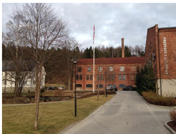
Fredfoss i Vestfossen i Øvre Eiker kommune - tidligere uldvarefabrikk, nå kurs- og konferansesenter. Spennende industrihistorisk anlegg gjenbrukt med sine kulturhistoriske kvaliteter i god behold.