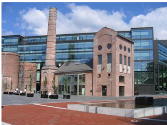
Byutvikling med bevaring og gjenbruk av historiske industrianlegg – Papirbredden i Drammen.

Det er viktig å få på plass en omforent plan for kulturminnevernet og kulturarvsektoren – gjerne med museene inkludert – da kulturminnevern er et ansvarsområde for mange flere aktører enn fylkeskommunen. Ved å etablere en felles plan for hvordan bruk og vern skal sikre våre viktigste kulturminner og –miljøer kan vi få til et godt samhandlingsverktøy som både kan bli inspirerende, utviklende, konfliktdepende og framtidsrettet – for hele kulturarvsektoren i Buskerud.