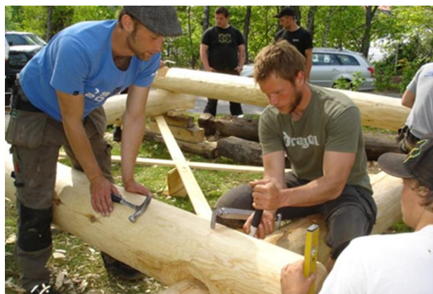
Opplæring av håndverkere i tradisjonshåndverk med museene som arena – positive samarbeidserfaringer i Buskerud