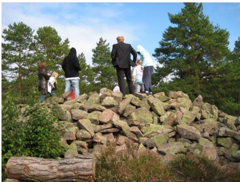
Elever fra Filtvet skole på Minnefinnekurs besøker lokale kulturminner som del av undervisningen. Formidling av kulturarv er et viktig forebyggende arbeid innenfor kulturminnevernet.

For mer informasjon om planarbeidet se www.bfk.no/kulturminnevern