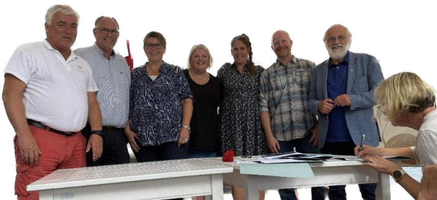
Signering av intensjonsavtale mellom USN og ordførarane i Hallingdal

signert ei intensjonsavtale om oppstart av Campus Hallingdal, eit fullverdige Campus i Hallingdal. I tillegg har det i 2022 vorte starta opp sjukepleiarutdanning i USN-regi på Torpomoen, det er avklara at Ål VGS får styrka sitt tilbod frå hausten med ambulanseutdanning og Fagskulen i Viken styrkar sitt tilbod på Geilo med utdanning innan helse, bygg/anlegg, øl og siderbrygging og stibygging, og Utdanningscenter Geilo (USG) har gjort avtale med Høgskulen på Vestlandet (HVL) om oppstart av nettbaserte studiar frå 2023.